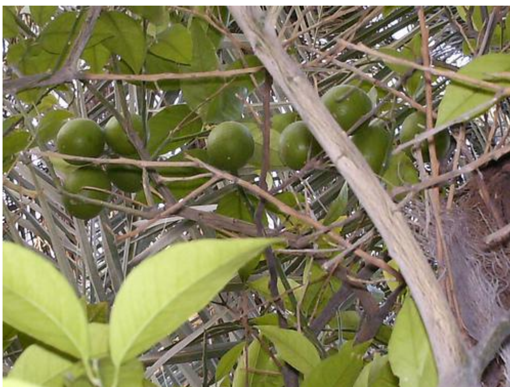
Hennatræet Lawsonia inermis

under pennen og tommelfingeren på knappen ovenpå. Tryk først knappen direkte ned, der burde nu kun komme luft ud af pennen, langsomt mens knappen er trukket ned, trækker du tommelfingeren tilbage mod dig selv og malingen skulle ud komme ud med luften. Mal forsigtigt og så vidt muligt kun i hullerne på skabelonen. Undgå meget maling, da det så løber og bliver grimt. Når hullerne er udfyldt med maling tages klister-skabelonen af, og vupti, en færdig lille tatoo. Når I er færdige med at male tatoo, så skal der hældes sprit i i stedet for maling og dette blæses igennem pennen for at rense den. Malebøtten tages af og vaskes med sprit, og hættten sættes på pennen igen, og det pakkes sammen i kassen. Tag gerne nogle billeder og print til bogen. I kan også lave jeres egne skabeloner - klisterpapir og små sakse og knive kan købes i hobby-forretninger.